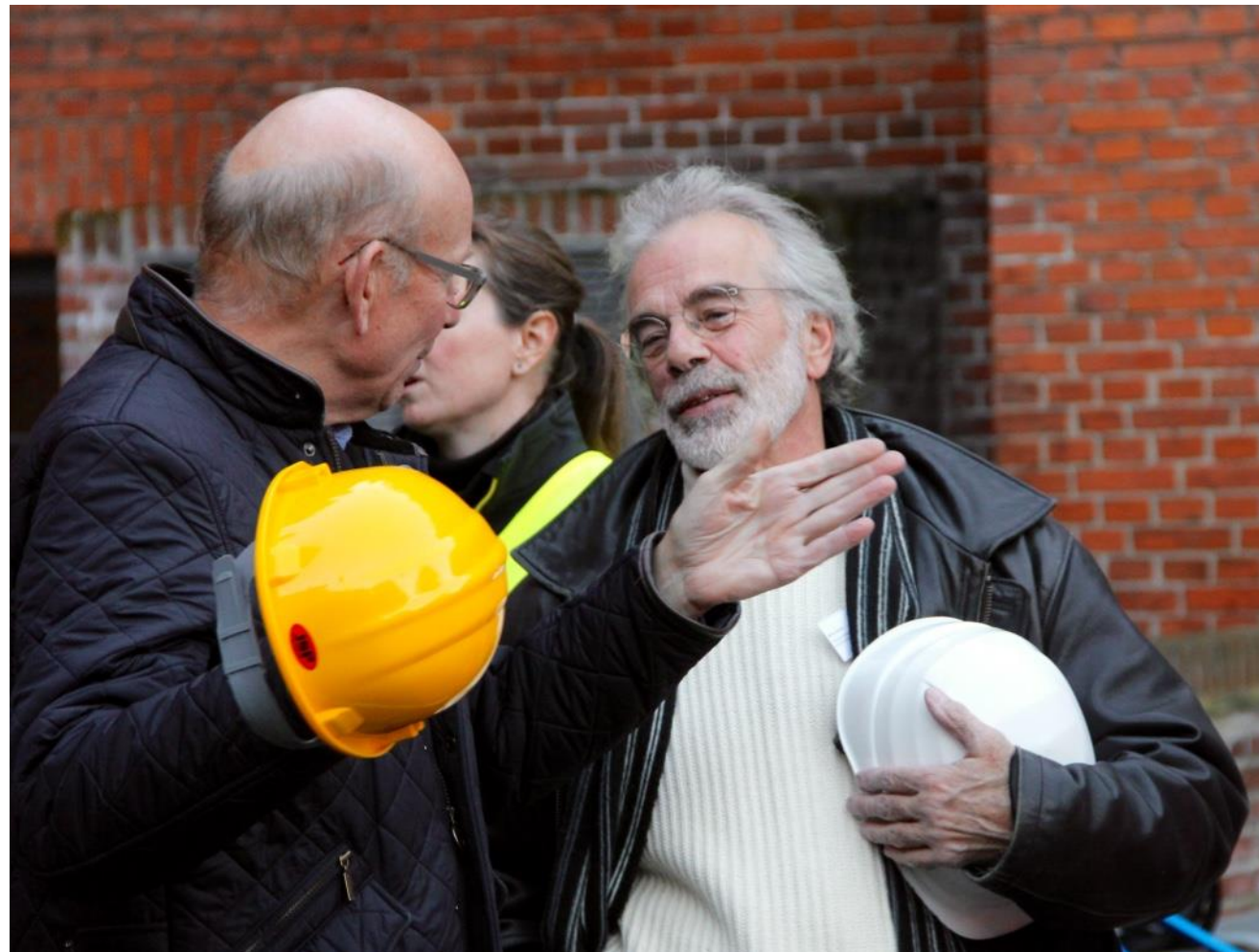
Hyggelig efterårsstemning ved Diakonissestiftelsens indgang.